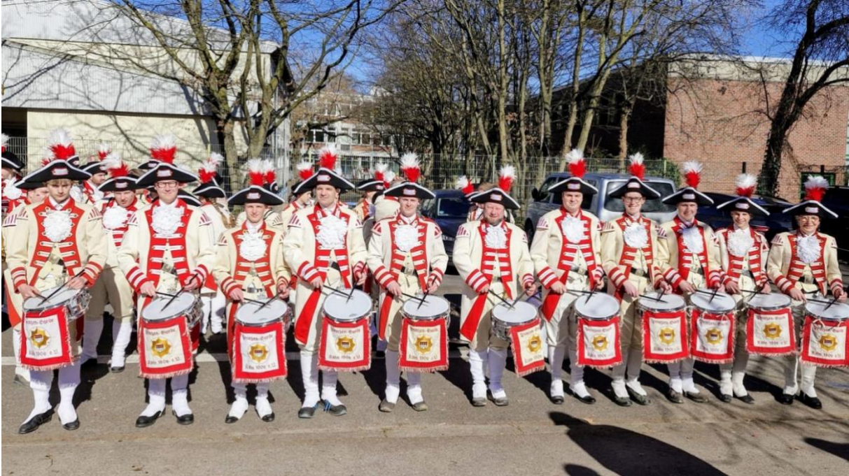
Der Spielmanns- und Fanfarenzug Fürstenau nimmt auch in diesem Jahr wieder als offizieller Spielmannszug der Prinzengarde Köln am dortigen Rosenmontagsumzug teil.