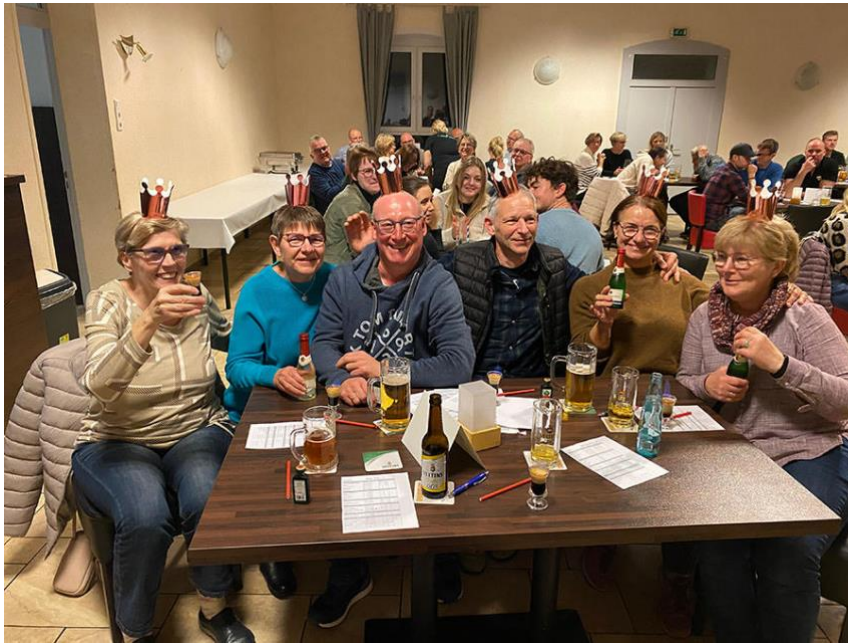
Im Saal der Gaststätte „Lindengarten“ findet das mittlerweile 6. „Fürstenauer Kneipenquiz“ statt. Die Gewinner kommen diesmal vom Team „FürstenFüchse“.