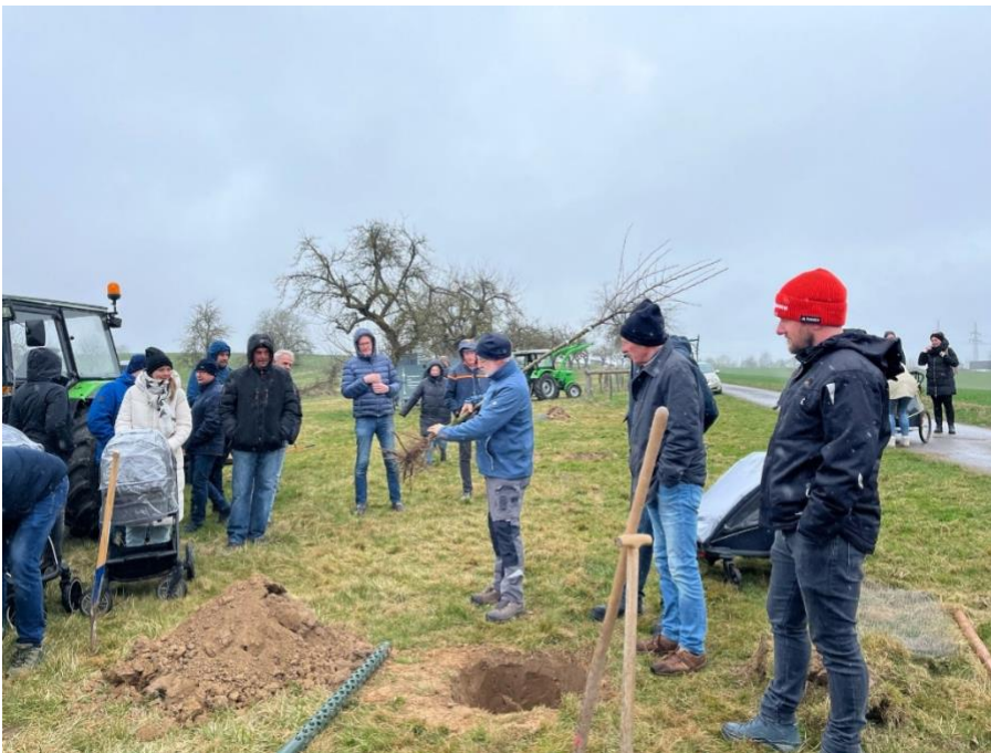
Am 10. März findet die 2. Baumpflanzaktion der Kulturgemeinschaft statt

Mit dieser Aktion werden für alle neu geborenen Kinder der Jahrgänge 2022 -2024 insgesamt 15 Obstbäume unter professioneller Anleitung gepflanzt, und die dann in der Zukunft hoffentlich reichlich Früchte tragen.