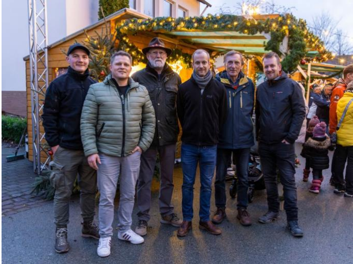
Organisatoren des Marktes, v.l.